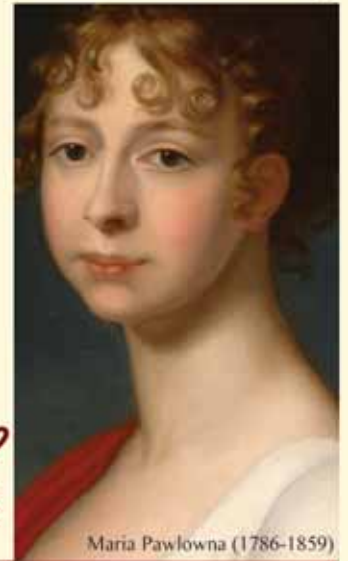
Maria Pawlowna (1786-1859)

1. Juni bis 3. Oktober 2010, dienstags - sonntags 10 - 18 Uhr